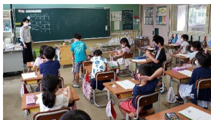
2年生 食育授業 「やさいはかせになろう」