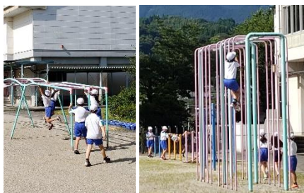
4年生 体育 サークット