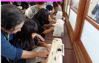
家庭科ミシン補助