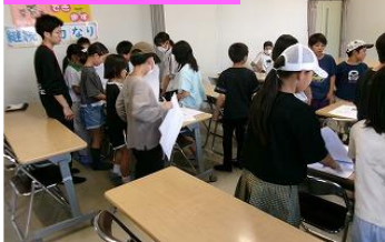
公民館お助けデー