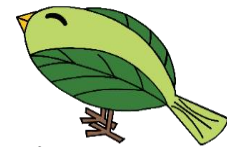
ハッピー 川添小公式キャラクター