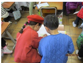
【年長児さんへアドバイス】

次年度、新1年生となる近隣幼児教育施設の年長児さんが、本校の現1年生と交流しました。初めて入る1年生の教室で、小学生の机とイスに座ってお絵かきをしたり、1年生の発表を見たりしました。1年生は、年長児さんに丁寧に小学校のことを教え、気分は2年生になったかのような様子でした。年長児さん、4月から安心して入学してくださいね。